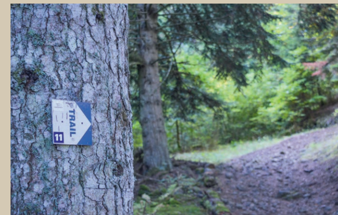
Points de vente de matériel trail : Le Lioran ou Prat de Bouc