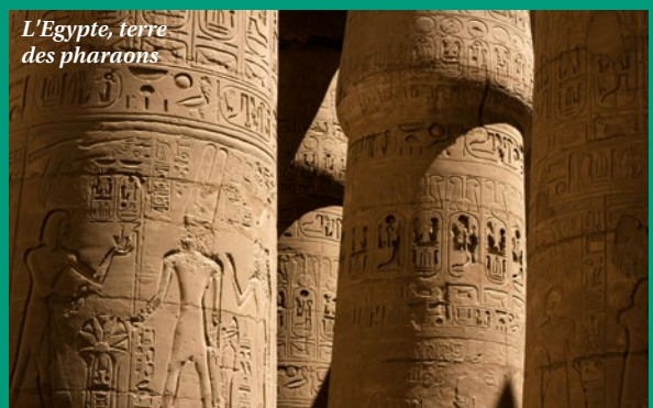
L'Égypte, terre des pharaons